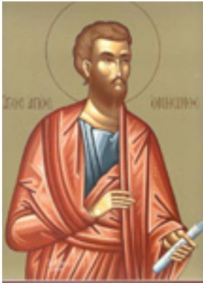
Άγιος Ονήσιμος / ο Απόστολος