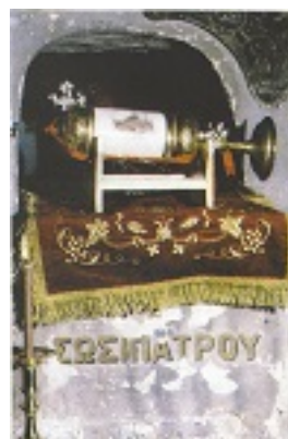
Η λειψανοθήκη του Αγίου Σωσιπάτρου στον ομώνυμο Ιερό Ναό της Κερκύρας