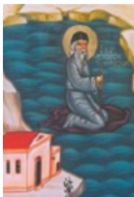
Ὅσιος Αὐξέντιος ὁ ἐν Καρτελίᾳ ασκήσας