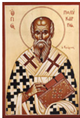
Άγιος Πολύκαρπος Επίσκοπος Σμύρνης