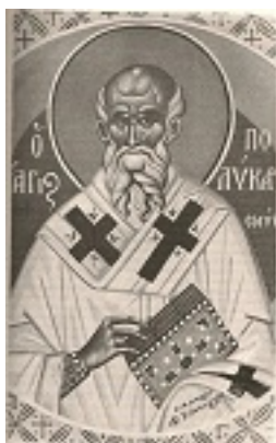
Άγιος Πολύκαρπος Επίσκοπος Σμύρνης - Φώτης Κόντογλου