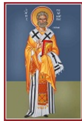
Άγιος Πολύκαρπος Επίσκοπος Σμύρνης - Καζακίδου Μαρία© (byzantineartkazakidou. blogspot.com)