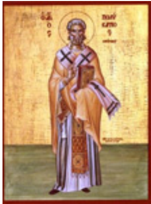
Άγιος Πολύκαρπος Επίσκοπος Σμύρνης