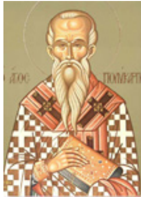
Άγιος Πολύκαρπος Επίσκοπος Σμύρνης