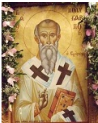
Άγιος Πολύκαρπος Επίσκοπος Σμύρνης