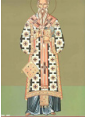
Άγιος Τάρασιος Αρχιεπίσκοπος Κωνσταντινούπολης