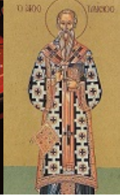
Άγιος Τάρασιος Αρχιεπίσκοπος Κωνσταντινούπολης