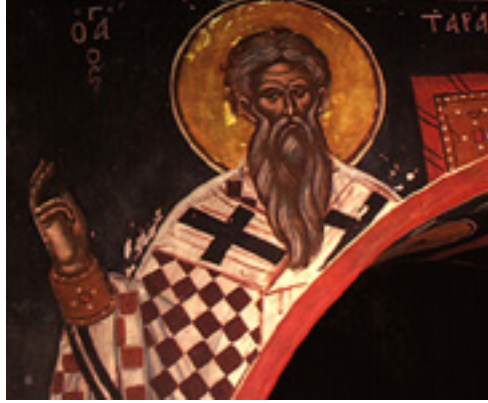
Άγιος Τάρασιος Αρχιεπίσκοπος Κωνσταντινούπολης