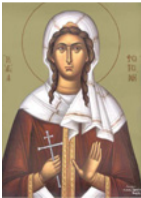
Αγία Φωτεινή η Μεγαλομάρτυς η Σαμαρείτιδα