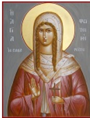
Αγία Φωτεινή η Μεγαλομάρτυς η Σαμαρείτιδα - Julia Hayes© ( www.ikonographics.net )