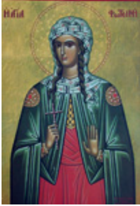
Αγία Φωτεινή η Μεγαλομάρτυς η Σαμαρείτιδα