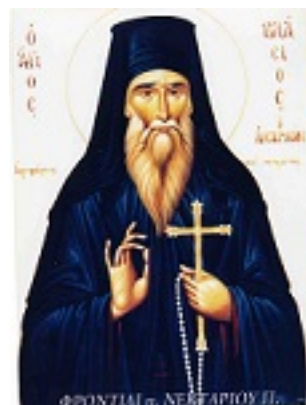
Άγιος Βλάσιος ο ιερομάρτυρας εξ Ακαρνανίας