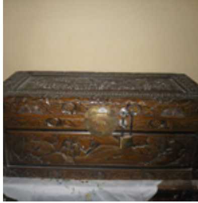
Λάρνακα των ιερών λειψάνων συναθλησάντων του Αγίου Βλασίου