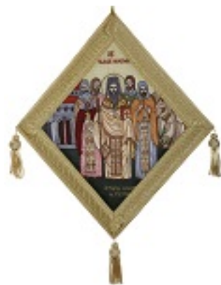
Άγιος Βλάσιος ο ιερομάρτυρας εξ Ακαρνανίας