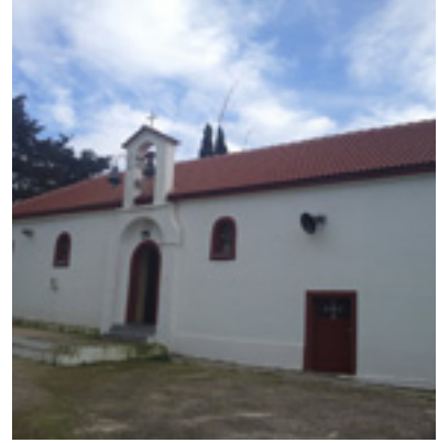
Ο Ιερός Ναός του Αγίου Βλασίου που χτίστηκε κατά τις υποδείξεις του απο την γερόντισσα Ευφροσύνη