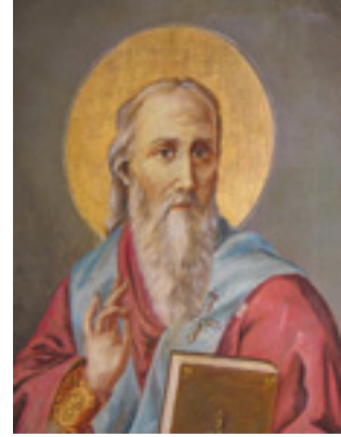
Η ιερή Εικόνα του Ιερομάρτυρος Βλασίου η οποία έγινε μετά απο παραγγελία του και κατα τις υποδείξεις της γερόντισσας Ευφροσύνης