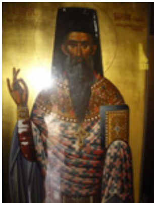
Άγιος Βλάσιος ο ιερομάρτυρας εξ Ακαρνανίας