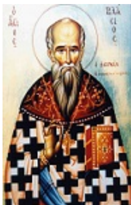
Άγιος Βλάσιος ο ιερομάρτυρας εξ Ακαρνανίας