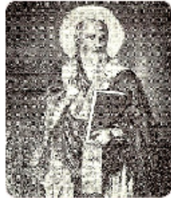
Άγιος Βλάσιος ο ιερομάρτυρας εξ Ακαρνανίας