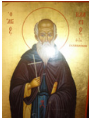
Ο Άγιος Βλάσιος όπως εμφανίστηκε στον άγιο γέροντα Παίσιο τον Αγιορείτη