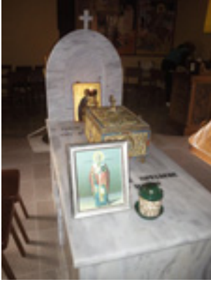
Ο Τάφος του Αγίου Βλασίου