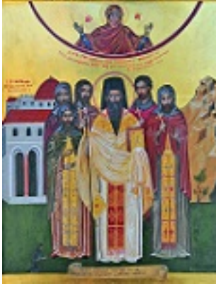
Άγιος Βλάσιος ο ιερομάρτυρας εξ Ακαρνανίας και οι συν αυτώ