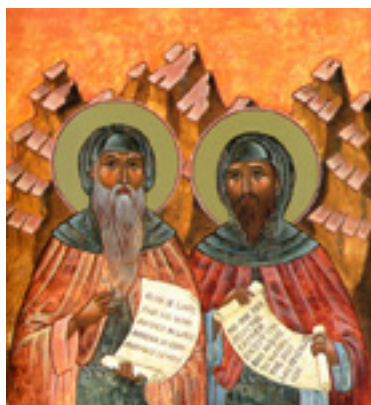
Όσιοι Βαρσανούφιος και Ιωάννης