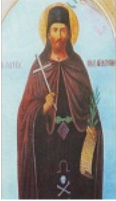
Άγιος Ηλίας ο Νέος Οσιομάρτυρας ο Αρδούνης