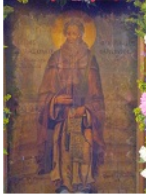
Άγιος Ηλίας ο Νέος Οσιομάρτυρας ο Αρδούνης