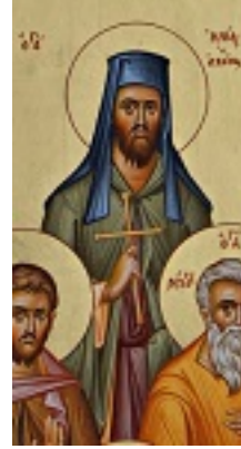
Άγιος Ηλίας ο Νέος Οσιομάρτυρας ο Αρδούνης