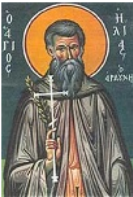
Άγιος Ηλίας ο Νέος Οσιομάρτυρας ο Αρδούνης