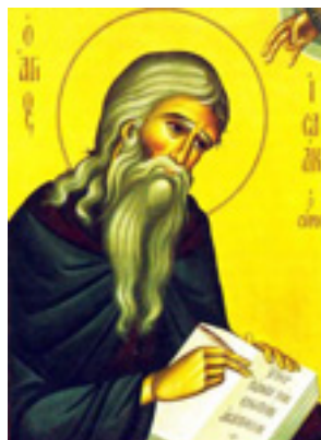
Όσιος Ισαάκ ο Σύρος