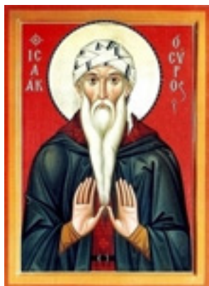
Όσιος Ισαάκ ο Σύρος