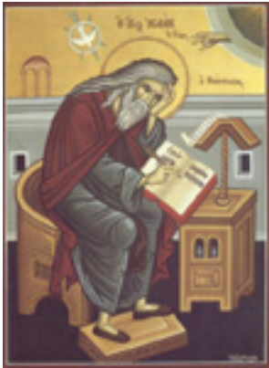
Όσιος Ισαάκ ο Σύρος