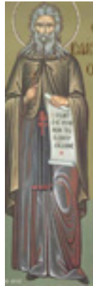
Όσιος Ισαάκ ο Σύρος