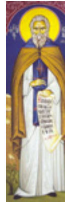
Όσιος Ισαάκ ο Σύρος