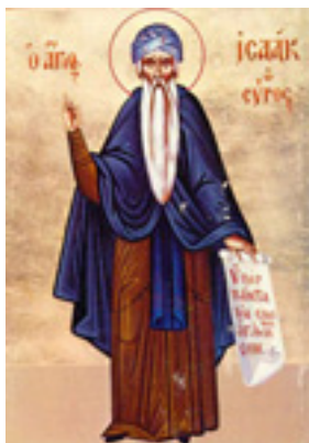
Όσιος Ισαάκ ο Σύρος