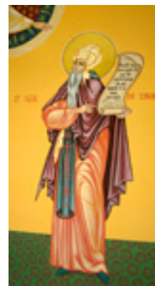
Όσιος Ισαάκ ο Σύρος