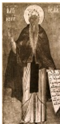
Όσιος Ισαάκ ο Σύρος