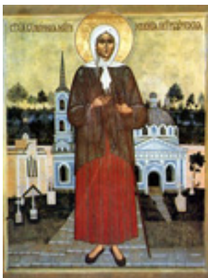
Οσία Ξένη η Διά Χριστόν Σαλή