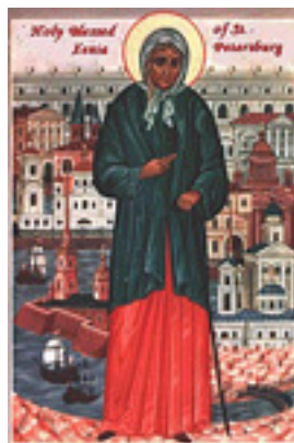
Οσία Ξένη η Διά Χριστόν Σαλή