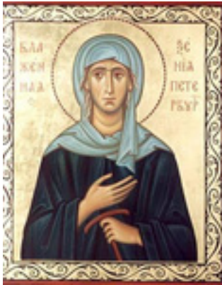
Οσία Ξένη η Διά Χριστόν Σαλή