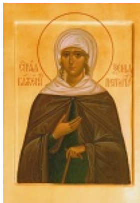
Οσία Ξένη η Διά Χριστόν Σαλή