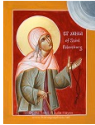
Οσία Ξένη η Διά Χριστόν Σαλή - Julia Hayes© (www.ikonographics.net)