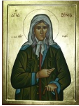
Οσία Ξένη η Διά Χριστόν Σαλή - Λυδία Γουριώτη© (lydiagourioti- iconography.blogspot.com)