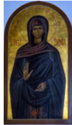
Οσία Ξένη η Διά Χριστόν Σαλή