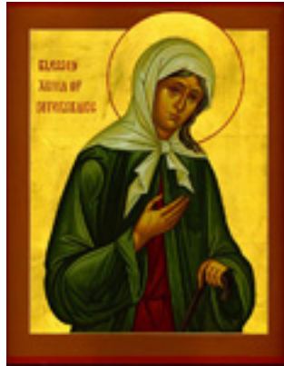
Οσία Ξένη η Διά Χριστόν Σαλή