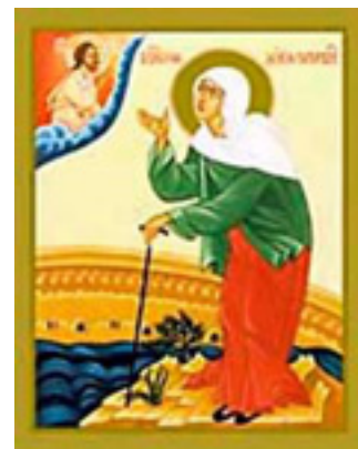
Οσία Ξένη η Διά Χριστόν Σαλή