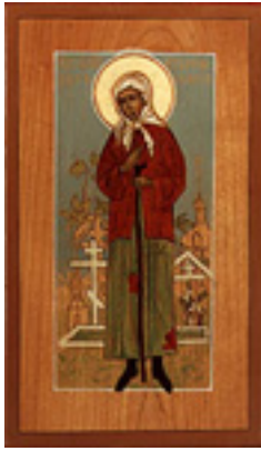
Οσία Ξένη η Διά Χριστόν Σαλή