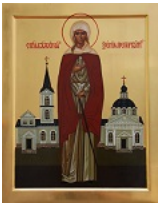
Οσία Ξένη η Διά Χριστόν Σαλή