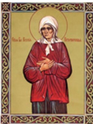
Οσία Ξένη η Διά Χριστόν Σαλή