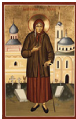
Οσία Ξένη η Διά Χριστόν Σαλή