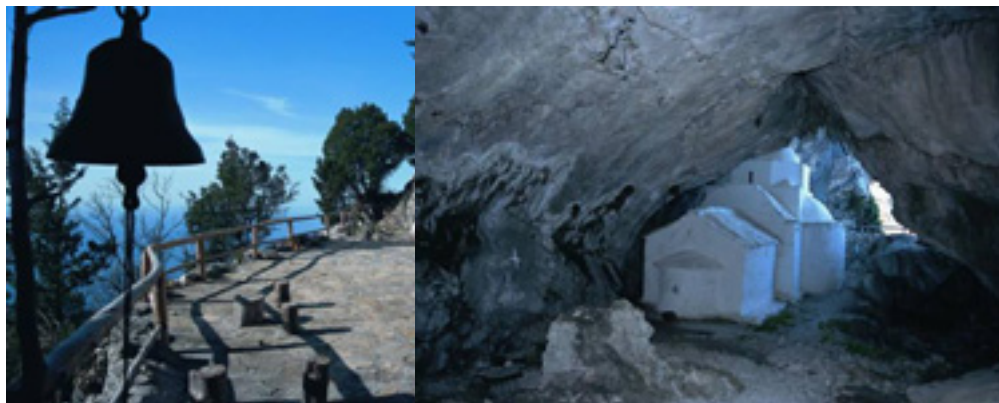
Παναγιά η Μακρινή<br />στην Σάμο Παναγιά η Μακρινή<br />στην Σάμο