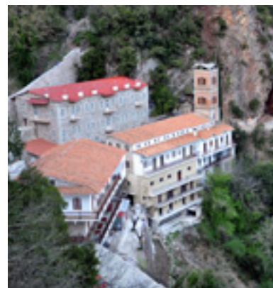
Ιερά Μονή Παναγιάς Προυσιώτισσας