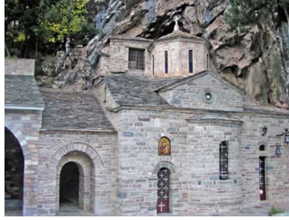
Παναγία Προυσιώτισσα η Αρχόντισσα της Ρούμελης