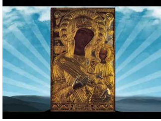
Παναγία Προυσιώτισσα - Απολυτίκιον & Μεγαλυνάρια