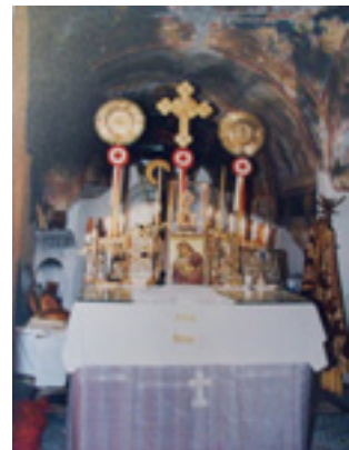
Παναγιά η Σκιαδενή στην Ρόδο