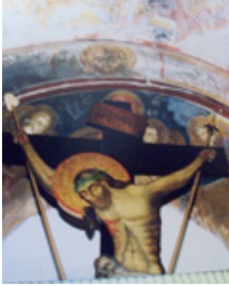
Παναγιά η Σκιαδενή στην Ρόδο