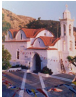
Παναγιά η Σκιαδενή στην Ρόδο