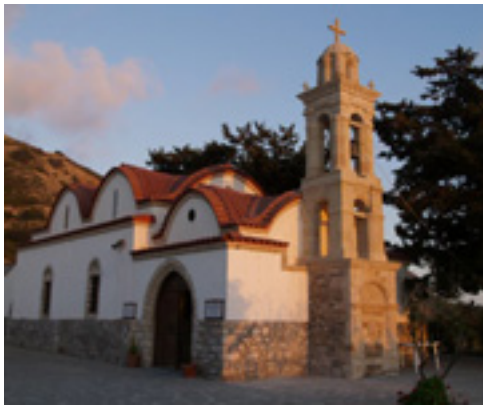
Παναγιά η Σκιαδενή στην Ρόδο