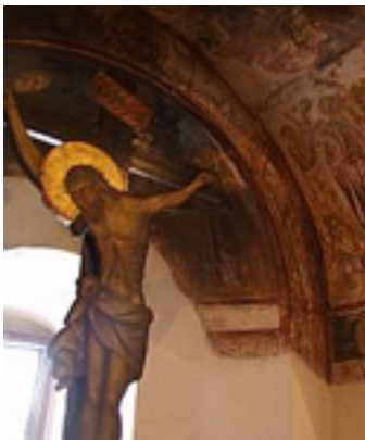
Παναγιά η Σκιαδενή στην Ρόδο