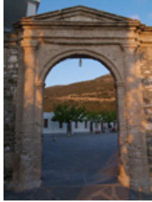
Παναγιά η Σκιαδενή στην Ρόδο