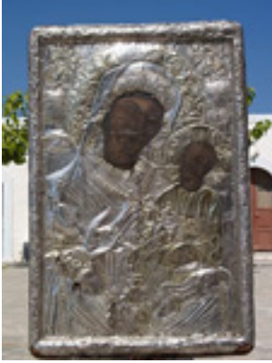
Παναγιά η Σκιαδενή στην Ρόδο