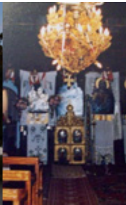
Παναγιά η Σκιαδενή στην Ρόδο