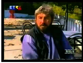
ΖΩΝΤΑΝΟ ΘΑΥΜΑ ΜΕ ΔΥΟ ΚΥΠΑΡΙΣΣΙΑ ΣΤΗ Ι.Μ.ΕΙΚΟΣΙΦΟΙΝΙΣΣΑ