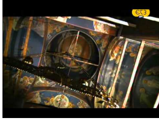
Ιερά μονοπάτια - ΕΤ3 Ι.Μ.Παναγίας Εικοσιφοίνισσας