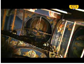
Ιερά μονοπάτια - ΕΤ3 Ι.Μ.Παναγίας Εικοσιφοίνισσας