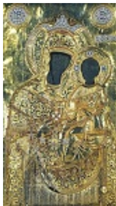
Σύναξη της Παναγίας της Εικοσιφοίνισσας