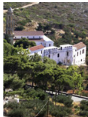
Παναγία η Μυρτιδιώτισσα στα Κύθηρα