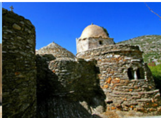
Παναγία η Δροσιανή