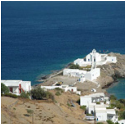
Παναγία η Χρυσοπηγή