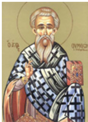
Άγιος Συμεών ο Αδελφόθεος Επίσκοπος Ιεροσολύμων