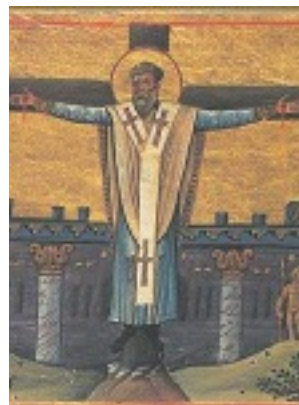
Άγιος Συμεών ο Αδελφόθεος Επίσκοπος Ιεροσολύμων