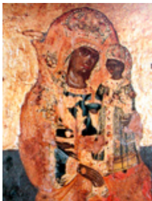
Παναγία η Ακαθής