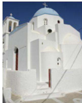
Παναγία η Ακαθής