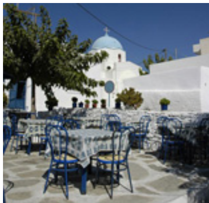
Παναγία η Ακαθής