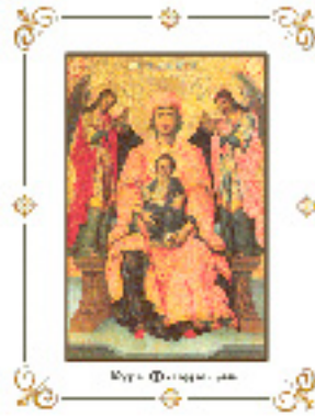
Παναγία η Φανερωμένη<br />στην Λευκάδα