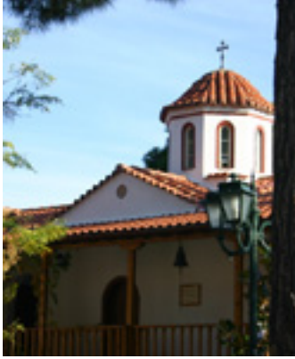
Παναγία η Φανερωμένη<br />στην Λευκάδα