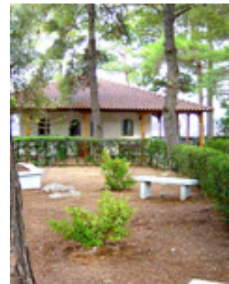
Παναγία η Φανερωμένη<br />στην Λευκάδα