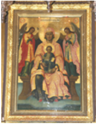
Παναγία η Φανερωμένη<br />στην Λευκάδα