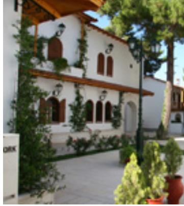
Παναγία η Φανερωμένη<br />στην Λευκάδα