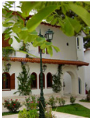
Παναγία η Φανερωμένη<br />στην Λευκάδα