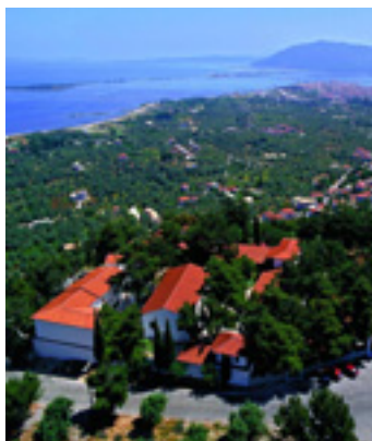
Παναγία η Φανερωμένη<br />στην Λευκάδα