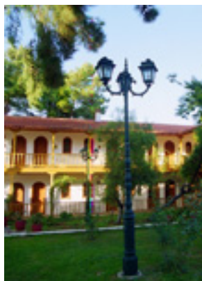
Παναγία η Φανερωμένη<br />στην Λευκάδα