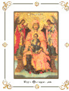
Παναγία η Φανερωμένη<br />στην Λευκάδα