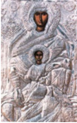
Παναγία η Χρυσολεόντισσα