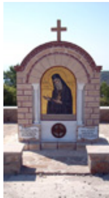
Προσκύνημα Αγίου Νεκταρίου