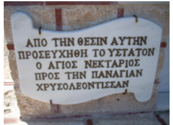
Προσκύνημα Αγίου Νεκταρίου