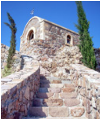
Το εκκλησάκι της Μεταμόρφωσης