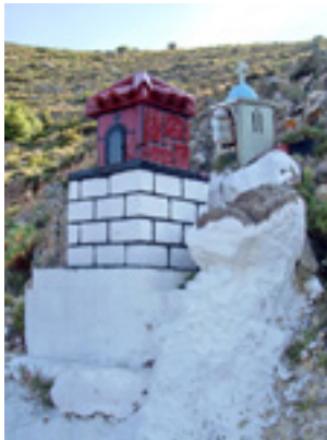
Το Χέρι της Παναγίας