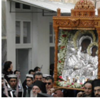
Παναγία η Θεοσκέπαστη στην Άνδρο