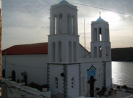
Παναγία η Θεοσκέπαστη στην Άνδρο