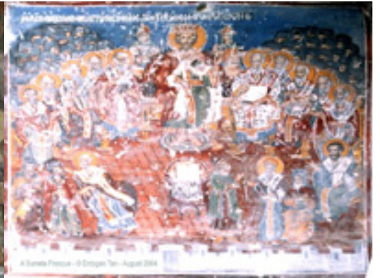
Τοιχογραφία από την Μονή Παναγίας Σουμελά στην Τραπεζούντα