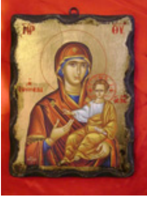
Παναγία Σουμελά (αντίγραφο)