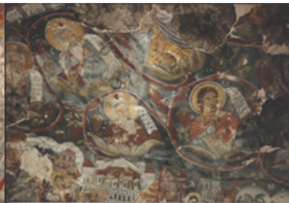
Τοιχογραφία από την Μονή Παναγίας Σουμελά στην Τραπεζούντα