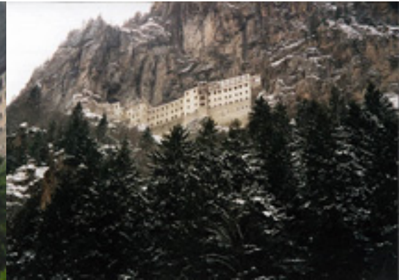
Η Μονή Παναγίας Σουμελά στην Τραπεζούντα