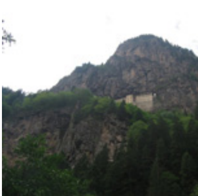
Η Μονή Παναγίας Σουμελά στην Τραπεζούντα