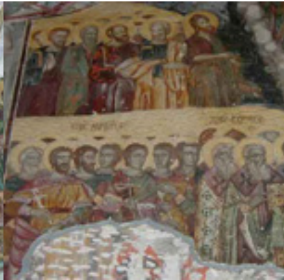
Τοιχογραφία από την Μονή Παναγίας Σουμελά στην Τραπεζούντα