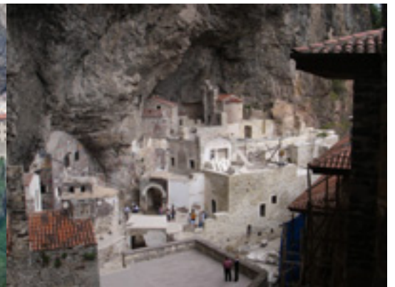
Η Μονή Παναγίας Σουμελά στην Τραπεζούντα