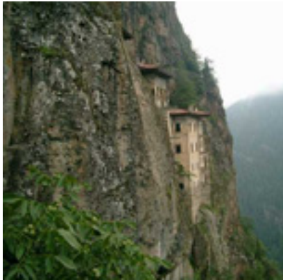
Η Μονή Παναγίας Σουμελά στην Τραπεζούντα