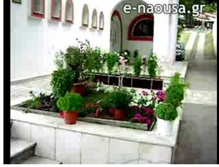
Παναγία Σουμελά -<br />Καστανιά Ημαθίας