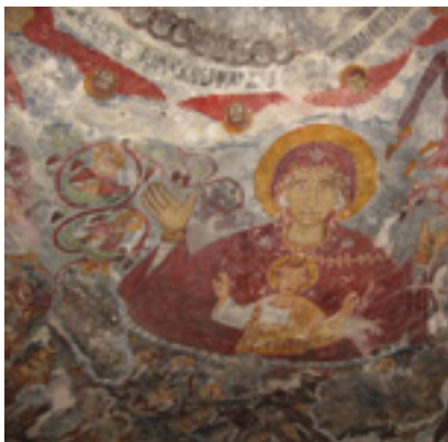
Τοιχογραφία από την Μονή Παναγίας Σουμελά στην Τραπεζούντα