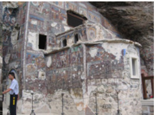
Η Μονή Παναγίας Σουμελά στην Τραπεζούντα