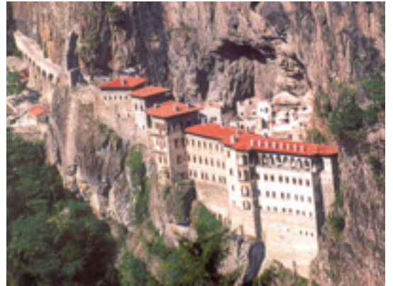
Η Μονή Παναγίας Σουμελά στην Τραπεζούντα