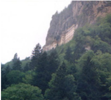
Η Μονή Παναγίας Σουμελά στην Τραπεζούντα