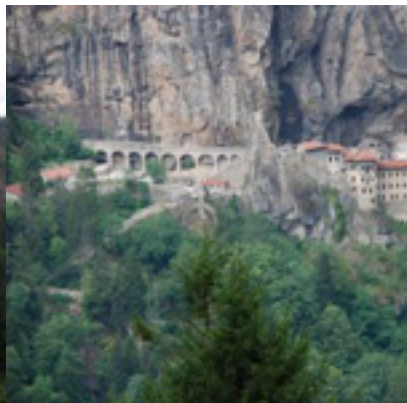
Η Μονή Παναγίας Σουμελά στην Τραπεζούντα