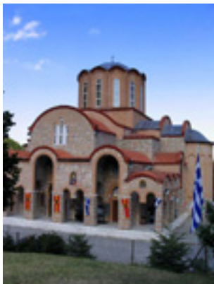
Η Μονή Παναγίας Σουμελά στην Καστανιά Ημαθίας