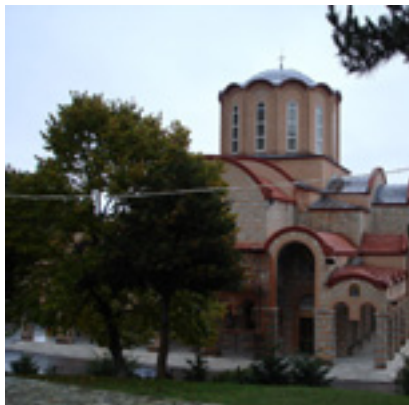
Η Μονή Παναγίας Σουμελά στην Καστανιά Ημαθίας