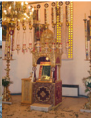
Η Μονή Παναγίας Σουμελά στην Καστανιά Ημαθίας