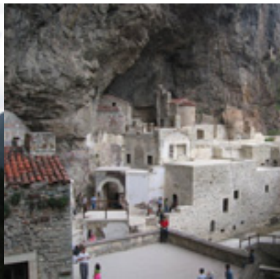
Η Μονή Παναγίας Σουμελά στην Τραπεζούντα