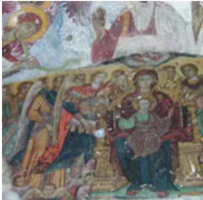
Τοιχογραφία από την Μονή Παναγίας Σουμελά στην Τραπεζούντα