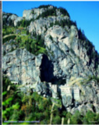
Η Μονή Παναγίας Σουμελά στην Τραπεζούντα