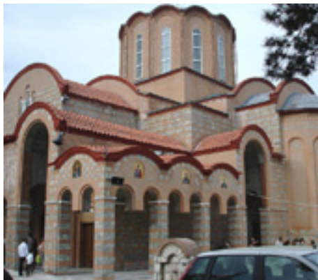
Η Μονή Παναγίας Σουμελά στην Καστανιά Ημαθίας