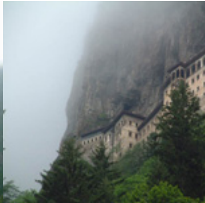
Η Μονή Παναγίας Σουμελά στην Τραπεζούντα