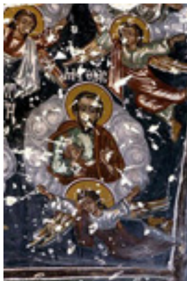
Τοιχογραφία από την Μονή Παναγίας Σουμελά στην Τραπεζούντα