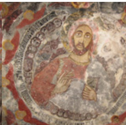
Τοιχογραφία από την Μονή Παναγίας Σουμελά στην Τραπεζούντα