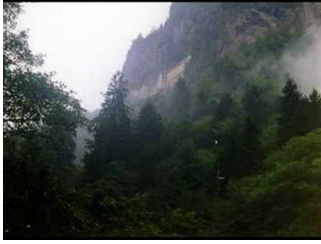
Παναγία Σουμελά -<br />Το παλιό μοναστήρι