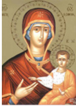
Παναγία Σουμελά (αντίγραφο)