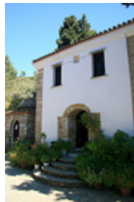
Παναγία η Κουνίστρα