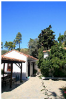
Παναγία η Κουνίστρα