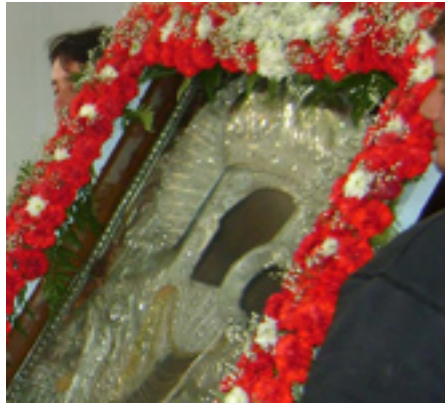
Παναγία η Μαλτέζα