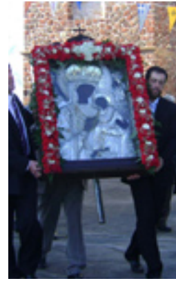
Παναγία η Μαλτέζα