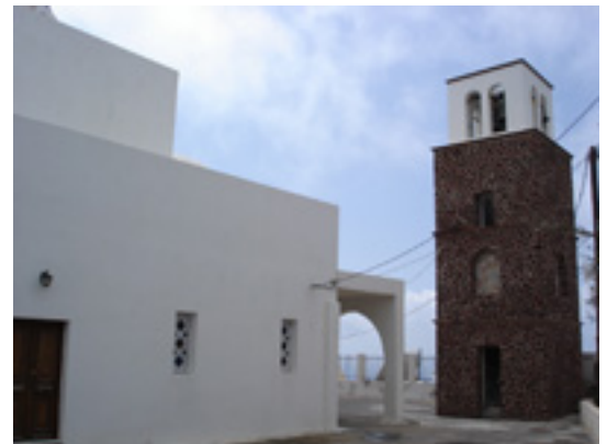
Παναγία η Μαλτέζα (Δημιουργός: Κλέαρχος Π. Καπούτσης)