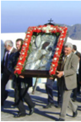
Παναγία η Μαλτέζα