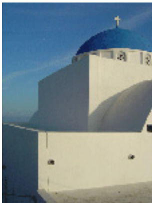
Παναγία η Μαλτέζα