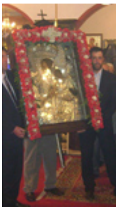
Παναγία η Μαλτέζα