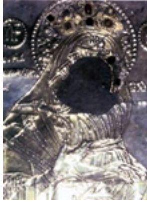
Παναγία η Χοζοβιώτισσα