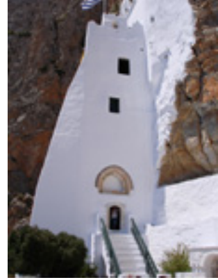
Παναγία η Χοζοβιώτισσα