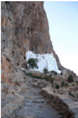
Παναγία η Χοζοβιώτισσα