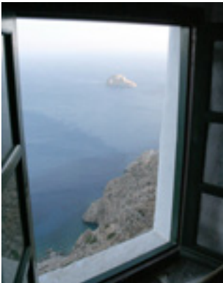
Παναγία η Χοζοβιώτισσα