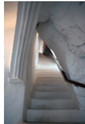
Παναγία η Χοζοβιώτισσα