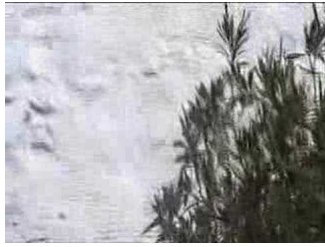
Παναγία η<br />Χοζοβιώτισσα