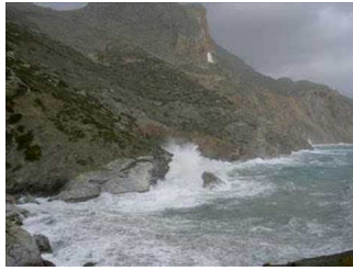
Παναγία η<br />Χοζοβιώτισσα