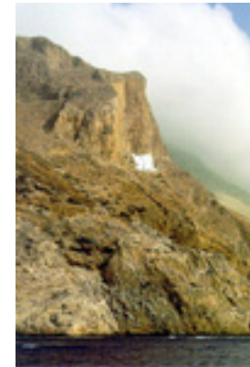
Παναγία η Χοζοβιώτισσα