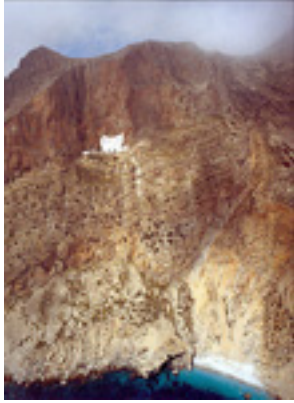
Παναγία η Χοζοβιώτισσα