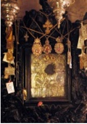
Παναγία η Χοζοβιώτισσα