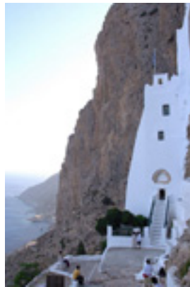
Παναγία η Χοζοβιώτισσα