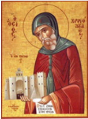
Όσιος Χριστόδουλος ο θαυματουργός, «ό έν Πάτμω»