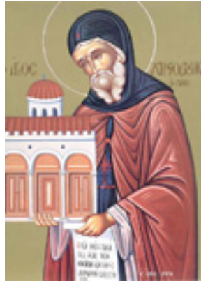
Όσιος Χριστόδουλος ο θαυματουργός, «ό έν Πάτμω»