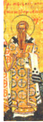
Άγιος Νικηφόρος ο Ομολογητής, Πατριάρχης Κωνσταντινουπόλεως