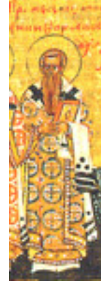
Άγιος Νικηφόρος ο Ομολογητής, Πατριάρχης Κωνσταντινουπόλεως