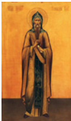
Όσιος Γεννάδιος ο εν<br />Κοστρόμα ο Λιθουανός