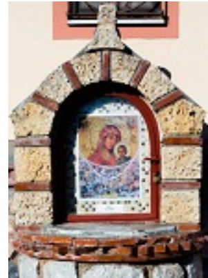
Σύναξη της Παναγιάς της Γοργοεπηκούου στην Μάνδρα Αττικής