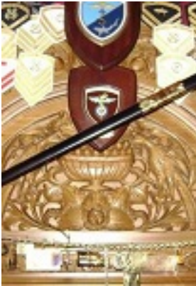
Σύναξη της Παναγιάς της Γοργοεπηκούου στην Μάνδρα Αττικής