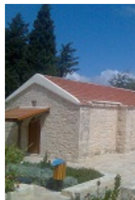
Η μοναδική εκκλησία στον κόσμο η οποία είναι αφιερωμένη στον Άγιο Καλανδίωνα