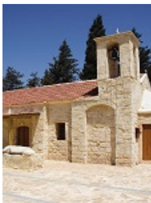
Η μοναδική εκκλησία στον κόσμο η οποία είναι αφιερωμένη στον Άγιο Καλανδίωνα