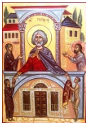
Άγιος Πέτρος ο μακάριος ο τελώνης