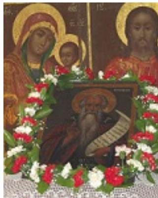
Η εικόνα του Αγίου Ευθυμίου που βρίσκεται στην ομώνυμη Ιερά Μονή στην Παλαιά πόλη των Ιεροσολύμων