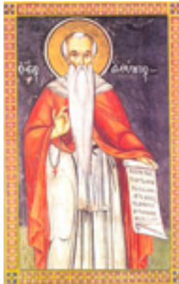
Όσιος Ευθύμιος ο Μέγας