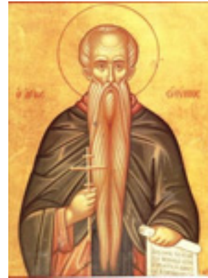
Όσιος Ευθύμιος ο Μέγας