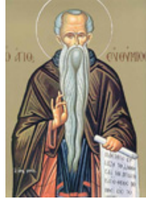
Όσιος Ευθύμιος ο Μέγας