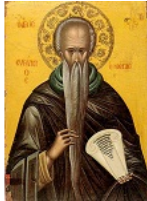
Όσιος Ευθύμιος ο Μέγας - 17ος αι. μ.Χ. - Μονή Διονυσίου, Άγιον Όρος