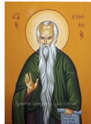
Όσιος Ευθύμιος ο Μέγας - Λυδία Γουριώτη© ( http://lydiagourioti- iconography.blogspot.com )