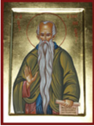
Όσιος Ευθύμιος ο Μέγας - Λυδία Γουριώτη© ( http://lydiagourioti- iconography.blogspot.com )