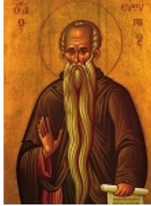
Όσιος Ευθύμιος ο Μέγας