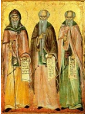
Άγιοι Αντώνιος, Ευθύμιος και Σάββας ο Ηγιασμένος - 1766 μ.Χ. - Νέα Σκήτη, Άγιον Όρος