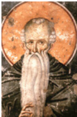
Όσιος Ευθύμιος ο Μέγας