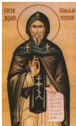
Όσιος Ιωαννίκιος ο εν Σερβία