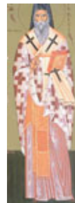
Άγιος Διονύσιος ο Νέος, ο Ζακυνθινός Αρχιεπίσκοπος Αιγίνης