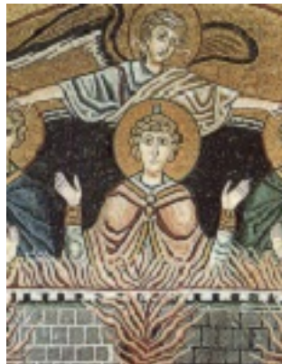
Άγιοι Τρεις Παιδες