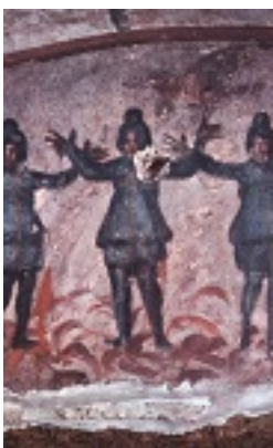
Οι Τρεις Παιδες εν Καμίνω, τοιχογραφία από την Κατακόμβη της Πρισίλλας στη Ρώμη, μέσα 3ου αι. μ.Χ.