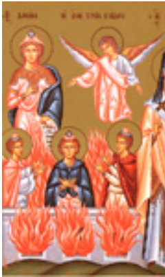
Ο Προφήτης Δανιήλ και οι Άγιοι Τρεις Παιδες