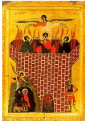
Οι Άγιοι Τρεις Παιδες μέσα στο καμίνι και ο Προφήτης Δανιήλ στον λάκκο των λεόντων (Δαν. κεφ. 3 και 6) - 18ος αι. μ.Χ. - Πρωτάτο, Άγιον Όρος