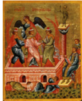
Άγιοι Τρεις Παιδες