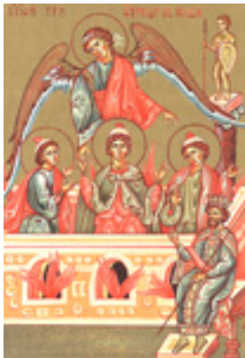
Άγιοι Τρεις Παιδες