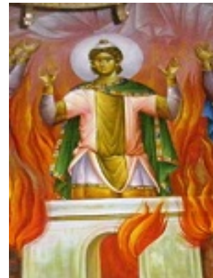
Άγιοι Τρεις Παιδες