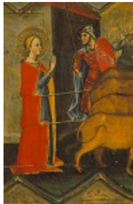
Αγία Λουκία η παρθένος