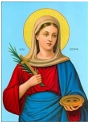
Αγία Λουκία η παρθένος