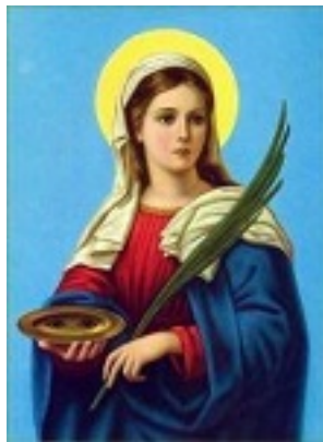
Αγία Λουκία η παρθένος