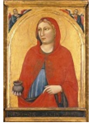
Αγία Λουκία η παρθένος