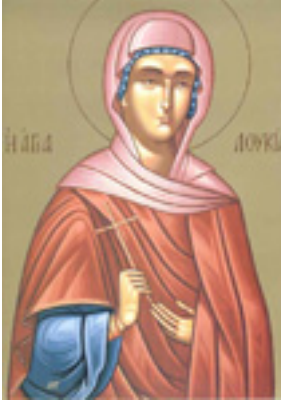
Αγία Λουκία η παρθένος