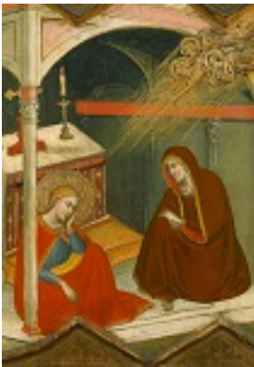
Αγία Λουκία η παρθένος