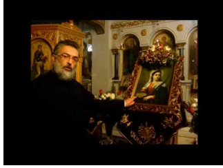
ΑΓΙΑ ΛΟΥΚΙΑ ΠΡΟΣΤΑΤΡΙΑ ΜΑΤΙΩΝ (13/12)