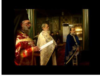
ΑΓΙΑ ΛΟΥΚΙΑ ΠΡΟΣΤΑΤΡΙΑ ΜΑΤΙΩΝ (13/12)