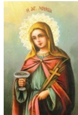
Αγία Λουκία η παρθένος