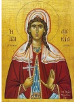
Αγία Λουκία η παρθένος