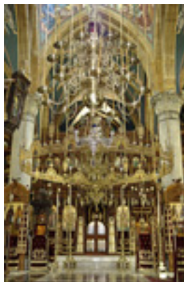
Αποψη του Καθολικού<br />της Μονής Μαχαιρά