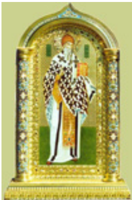
Άγιος Σπυρίδων ο Θαυματουργός, επίσκοπος Τριμυθούντος Κύπρου