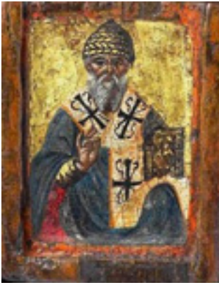
Άγιος Σπυρίδων ο Θαυματουργός, επίσκοπος Τριμυθούντος Κύπρου