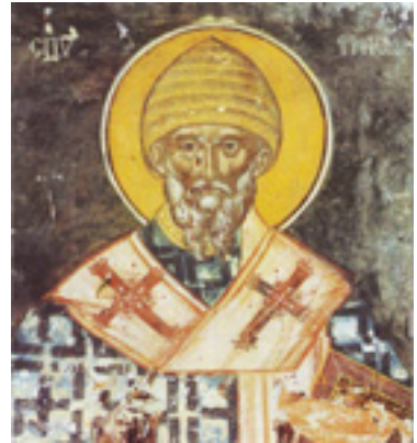
Άγιος Σπυρίδων ο Θαυματουργός, επίσκοπος Τριμυθούντος Κύπρου - Τέλη 15ου αι. μ.Χ. Καρουσάδες, ναός Αγίας Αικατερίνης. Νότιος τοίχος.