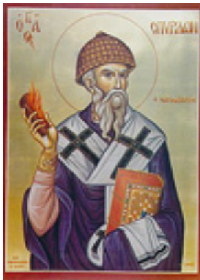
Άγιος Σπυρίδων ο Θαυματουργός, επίσκοπος Τριμυθούντος Κύπρου