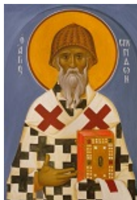
Άγιος Σπυρίδων ο Θαυματουργός, επίσκοπος Τριμυθούντος Κύπρου - Ι. Ν. Οσίων Παρθενίου και Ευμενίου των εν Κουδουμά, δια χειρός Παναγώτη Μόσχου (2006 μ.Χ.)