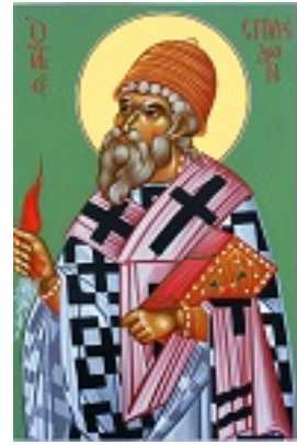
Άγιος Σπυρίδων ο Θαυματουργός, επίσκοπος Τριμυθούντος Κύπρου - Μιχαήλ Χατζημιχαήλ© www.michaelhadjimichael.com