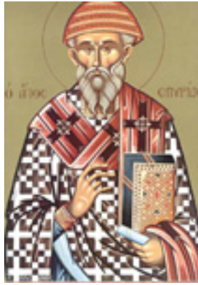
Άγιος Σπυρίδων ο Θαυματουργός, επίσκοπος Τριμυθούντος Κύπρου