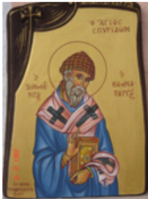
Άγιος Σπυρίδων ο Θαυματουργός, επίσκοπος Τριμυθούντος Κύπρου