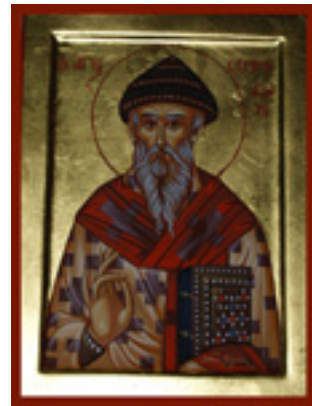
Άγιος Σπυρίδων ο Θαυματουργός, επίσκοπος Τριμυθούντος Κύπρου - Λυδία Γουριώτη© ( http://lydiagourioti- iconography.blogspot.com )