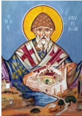
Άγιος Σπυρίδων ο Θαυματουργός, επίσκοπος Τριμυθούντος Κύπρου (Ιερών Ησυχαστήριον Αναστάσιος Χριστού - Πειραιεύς)