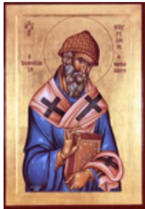
Άγιος Σπυρίδων ο Θαυματουργός, επίσκοπος Τριμυθούντος Κύπρου