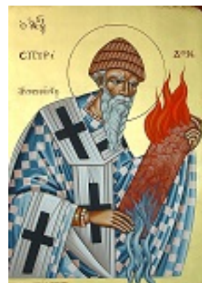
Άγιος Σπυρίδων ο Θαυματουργός, επίσκοπος Τριμυθούντος Κύπρου - Π. Κούβαρη και Ι. Χ. Θωμάς© ( icones.gr )