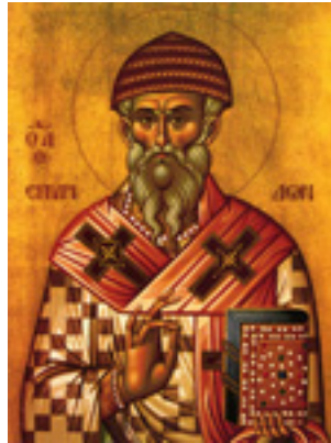
Άγιος Σπυρίδων ο Θαυματουργός, επίσκοπος Τριμυθούντος Κύπρου