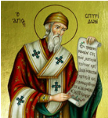
Άγιος Σπυρίδων ο Θαυματουργός, επίσκοπος Τριμυθούντος Κύπρου