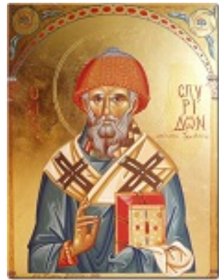
Άγιος Σπυρίδων ο Θαυματουργός, επίσκοπος Τριμυθούντος Κύπρου - Γεωργία Δαμκούκα© ( http://www.tempera.gr )