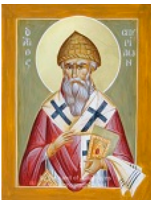
Άγιος Σπυρίδων ο Θαυματουργός, επίσκοπος Τριμυθούντος Κύπρου - Julia Hayes© ( www.ikonographics.net )