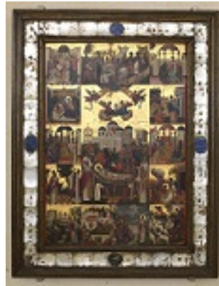
Η Κοίμηση του Αγίου Σπυρίδωνος και σκηνές του βίου του - Εμμανουήλ Τζανφουρνάρης, 1595 μ.Χ.