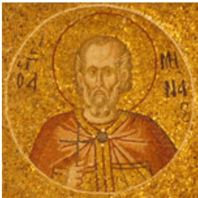
Άγιος Μηνάς ο Καλλικέλαδος