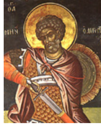
Άγιος Μηνάς ο Καλλικέλαδος