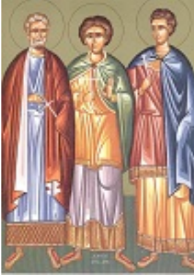
Άγιοι Μηνάς ο Καλλικέλαδος, Ερμωγένης και Εύγραφος