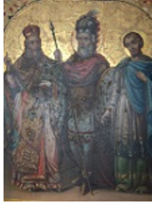
Άγιοι Μηνάς ο Καλλικέλαδος, Ερμωγένης και Εύγραφος