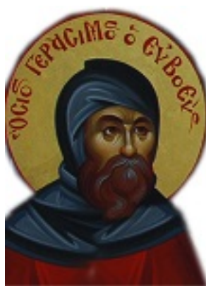
Όσιος Γεράσιμος ο εξ Ευρίπου