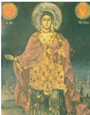
Άγιος Ιωάννης ο ράφτης