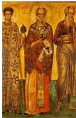
Άγιος Στέφανος, Νικόλαος, Ιωάννης ο Θεολόγος - 16ος και 18ος αι. μ.Χ. - Πρωτάτο, Άγιον Όρος