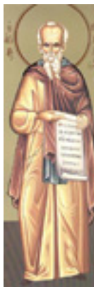
Άγιος Θεόδωρος ο Γραπτός