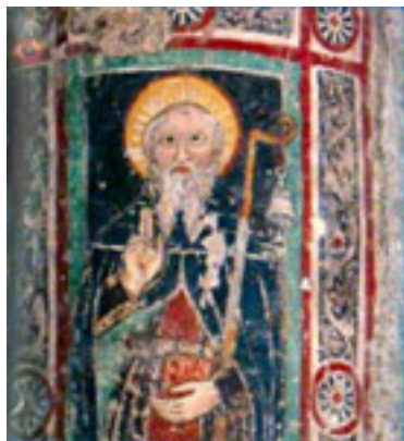
Άγιος Columbanus απόστολος της Γαλλίας