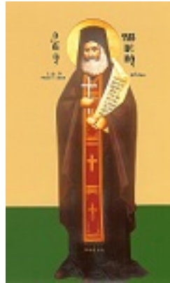
Άγιος Φιλούμενος ο Νεοιερομάρτυρας