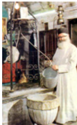
Άγιος Φιλούμενος ο Νεοιερομάρτυρας