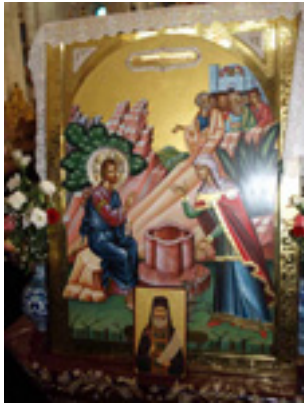
Άγιος Φιλούμενος ο Νεοιερομάρτυρας