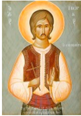
Άγιος Γεώργιος ο Νεομάρτυρας από τη Χίο - Julia Hayes© (www.ikonographics.net)