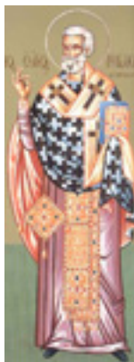
Άγιος Γρηγόριος επίσκοπος Ακραγαντίων