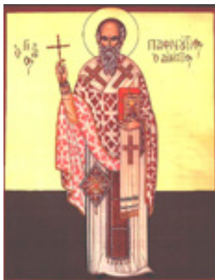
Άγιος Παφνούτιος ο Ιεροσολυμήτης, Ιερομάρτυρας